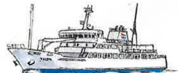
ははしま丸(3) (伊豆諸島開発) 2016-