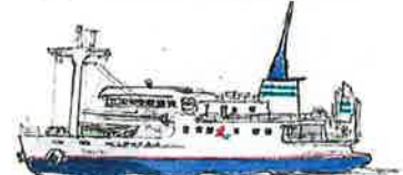
フェリー・あざり丸 (神新汽船) 2014-