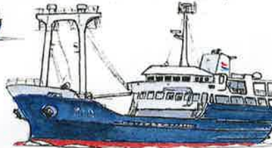
ゆり丸 (伊豆諸島開発) 469t 1998-2021