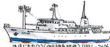
ははしま丸(2) (伊豆諸島開発) 1991-2016