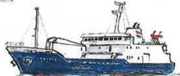
あまがしま丸 (伊豆諸島開発) 2013-