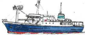
あざり丸 (神新汽船) 1988-2014